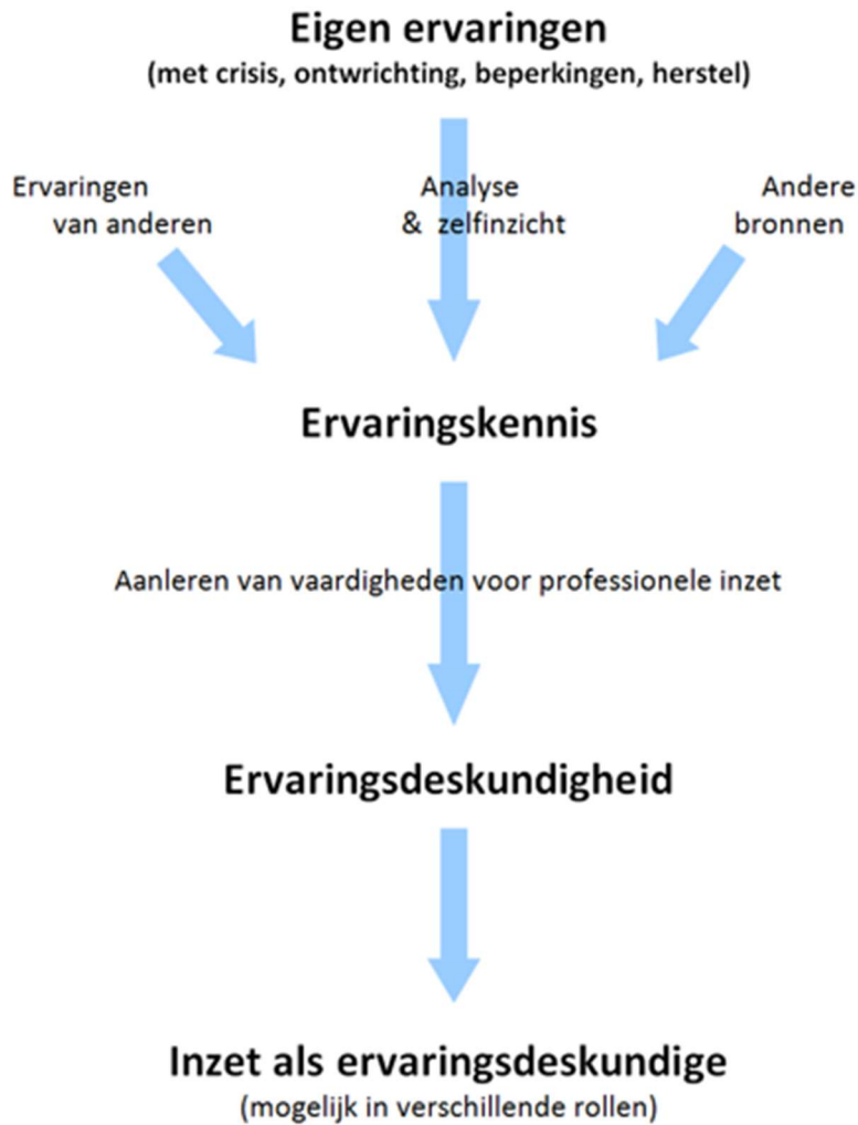
Figuur 1. Onderscheid tussen ervaringen, ervaringskennis en ervaringsdeskundigheid (Van Erp, Van Vugt, & Boertien, 2022)

Verder hanteren we de brede definitie van huiselijk geweld 1 waar partnergeweld en nadrukkelijk ook elke vorm van kindermishandeling onder valt.