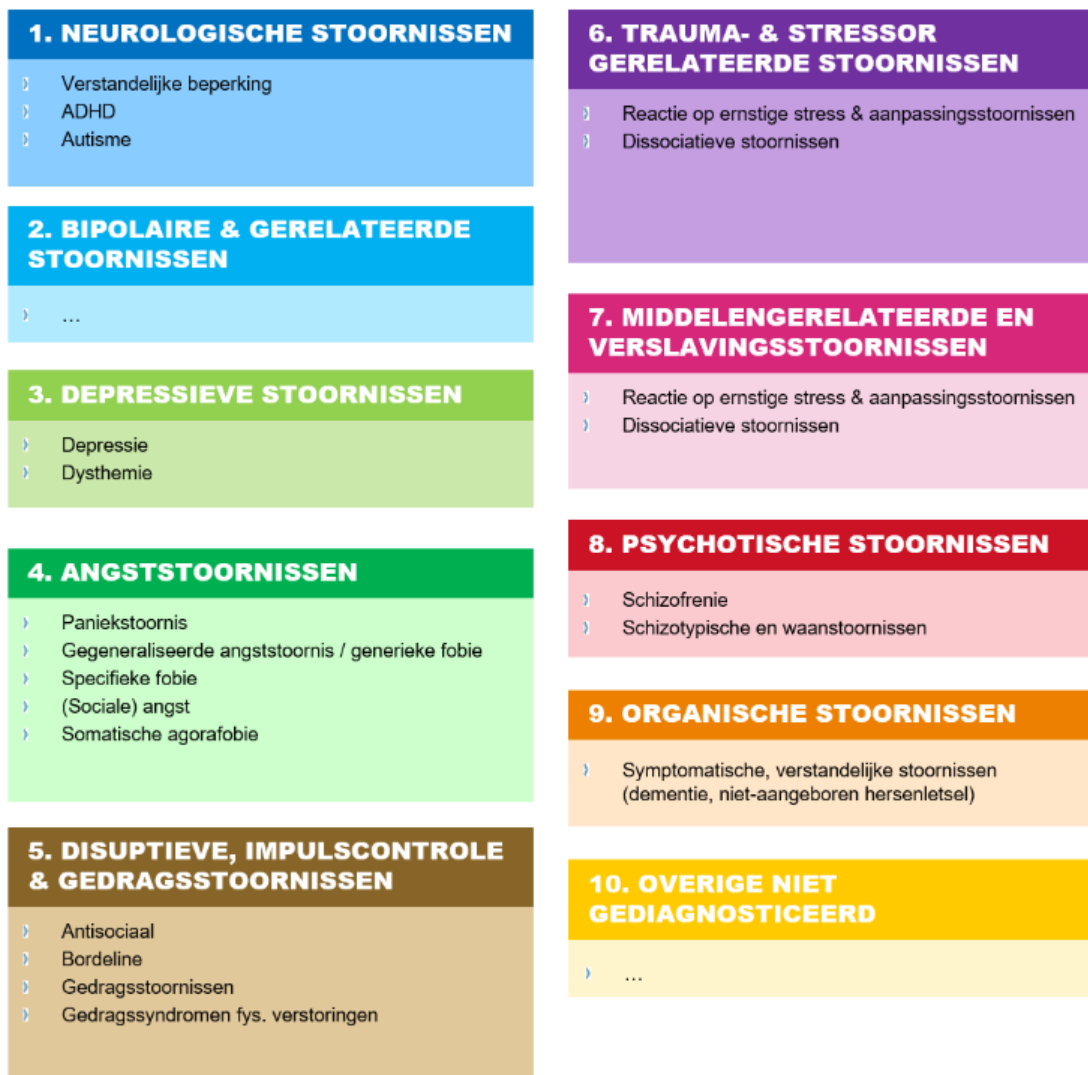
Figuur 2. Overzicht van de geselecteerde subgroepen.

In tabel 1 worden in de eerste kolom de tien subgroepen genoemd, met elk de belangrijkste stoornissen. In de voetnoten van de tabel worden de gebruikte subgroepen, stoornissen en terminologie nader verantwoord. In bijlage A geven we een korte toelichting voor elk van de tien subgroepen.