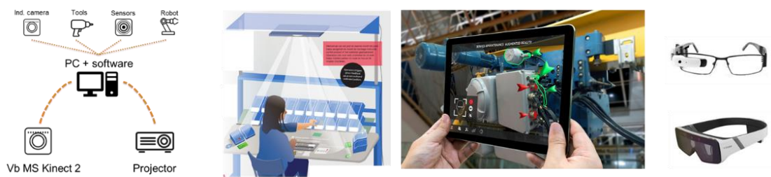
Figuur 3. Toepassing van AR voor het geven van werkinstructies.