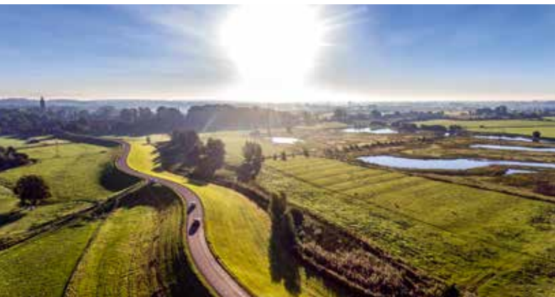
▲ Afb. 2. De Lekdijk beschermt een groot deel van de Randstad tegen overstromingen.

om het economische hart van Nederland, een gebied waar veel auto- en spoorwegen doorheen lopen. Als de Lekdijk doorbreekt, kan een groot deel van de Randstad overstroomd, tot Amsterdam aan toe.