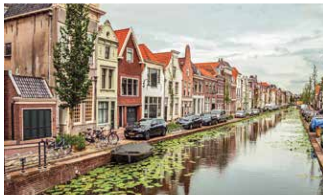
▲ Afb. 3. Verzakking van huizen als gevolg bodemdaling.

Als we inderdaad overgaan op geothermie, moeten we wel precies weten waar dat warme water zich precies in de ondergrond bevindt. Ook hier zijn betrouwbare data over de ondergrond onmisbaar. Dankzij die informatie kunnen we namelijk voor grote delen van ons land vaststellen in hoeverre een locatie geschikt is als bron van warmte. De voorgaande voorbeelden maken het al wel duidelijk: voor elke situatie is andere informatie over de ondergrond nodig. En in Nederland vinden we dat heel belangrijk; zo zijn we het eerste land met een Basisregistratie