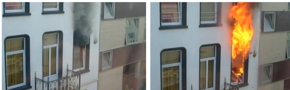
Figuur 3 Beeld case Keukenbrand met links de foto en rechts het laatste beeld van de video.

Bepaalde cases springen er echter uit. Zo wordt de case van een keukenbrand in alle gevallen juist en meer volledig uitgevoerd bij het tonen van beeld. De duur van deze melding is bij het tonen van een foto ongeveer gelijk aan de melding zonder beeld, maar met het tonen van een video zelfs 23 seconden sneller.