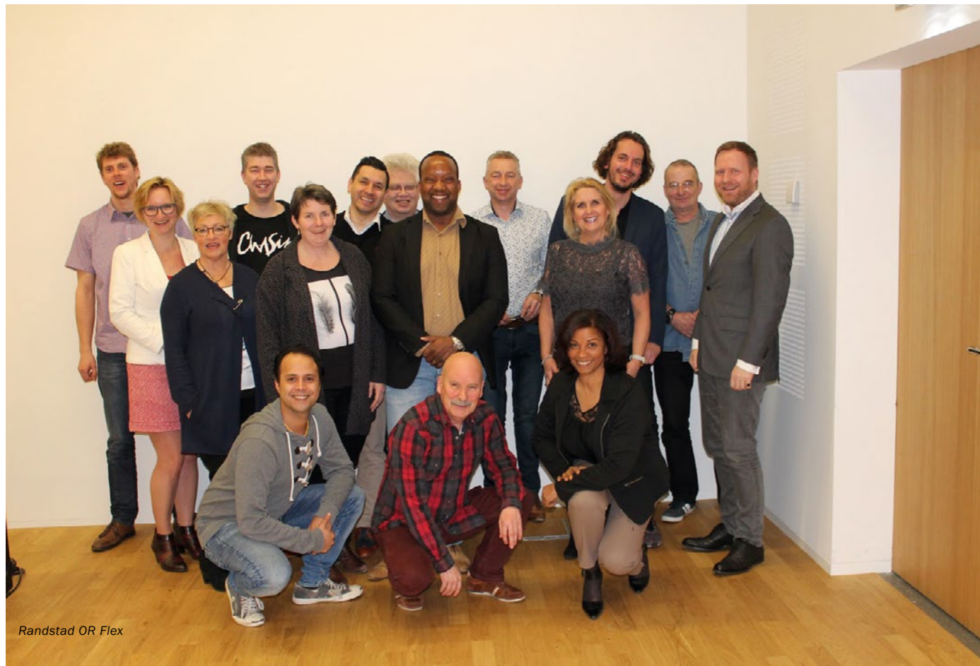
Randstad OR Flex