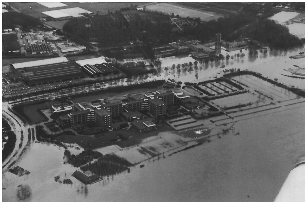
Figuur 2 Het Venlose St. Maartens Gasthuis (thans VieCuri MC) helemaal omsloten door het Maaswater.

Na de overstroming in 1995 is een dijk aangelegd, die het ziekenhuisterrein afgrenst van de Maas. In de zomer van 2009 ontstond opnieuw wateroverlast, dit keer als gevolg van kortstondige, extreem hevige regenval. Het gevolg was dat: