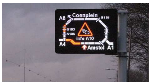
Figuur 3: Voorbeeld van een GRIP

Aangezien de hoeveelheid informatie die we tegelijkertijd kunnen verwerken beperkt is, is het van belang de weggebruiker van informatie te voorzien die niet verwarrend is of specifieke voorkennis vergt, aangezien dit kan leiden tot onbegrip, het negeren van informatie en een te hoge werklast bij de weggebruiker. Bij het gebruik van de zogenoemde bermGRIPs (Grafisch Route Informatie Panelen) (zie Figuur 3) is het bijvoorbeeld van belang een goede balans te houden tussen wat er technisch mogelijk is en wat de weggebruiker aan informatie kan verwerken. Veelal staat er veel te gedetailleerde informatie op de GRIPs. Bovendien moet de configuratie van het netwerk die wordt gepresenteerd overeenkomen met de mentale representatie van het netwerk dat de weggebruiker heeft. Alle informatie die wordt gegeven is vooral nuttig voor de ter plekke bekende weggebruiker en zorgt vaak voor verwarring en/of afleiding bij de weggebruiker die niet bekend is op de betreffende locatie (Heinen & Sijpersma, 2011).