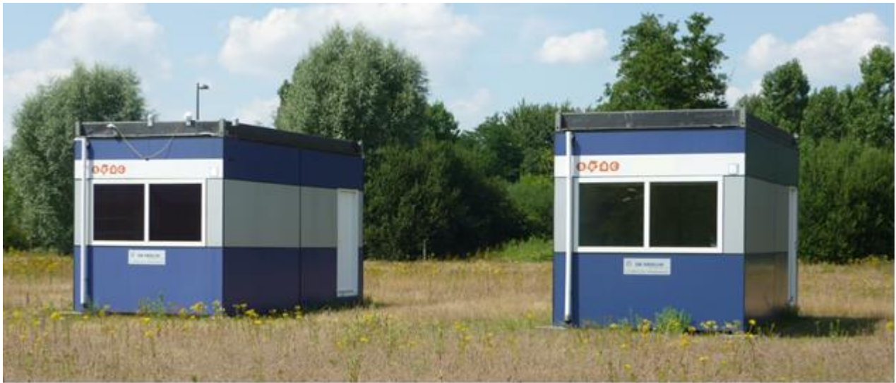
Figuur 1 Veldtest met Smart Energy Windows in de linker cabine en referentieglass (en niet zichtbare jaloezieën) in de rechter cabine.

gecommercialiseerd door Peer+. De ramen baseren op liquid crystal technologie en streven naar een autonome installatie (off-grid, geen kabels buiten raam) en draadloze afstandsbediening. Andere schakelende raam technologieën, zoals electrochrom, thermochroom en fotochrom hebben vaak verschillende nadelen, zoals gebrekkige regelmogelijkheden, gebrekkig comfort of een complexe installatie.