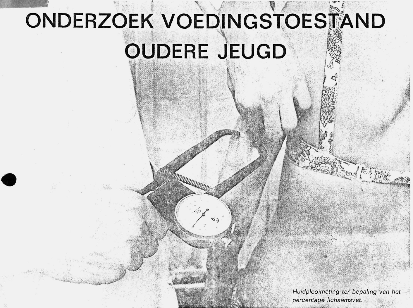
Huidplooiemeting ter bepaling van het percentage lichaamsvet.