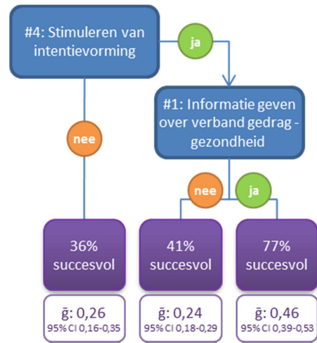
Figuur 1: Classificatieboom met methodieken van de motivatiefase voor interventies die methodieken uit deze fase gebruikten (n=106).

Tot slot is gekeken naar de effecten van de methodieken over de drie fasen heen. De classificatieboom over de fasen bestond uit de combinatie van de vijf meest succesvolle methodieken per fase: Stimuleren om gedragsdoelen te herzien , Moeilijkheidsgraad van