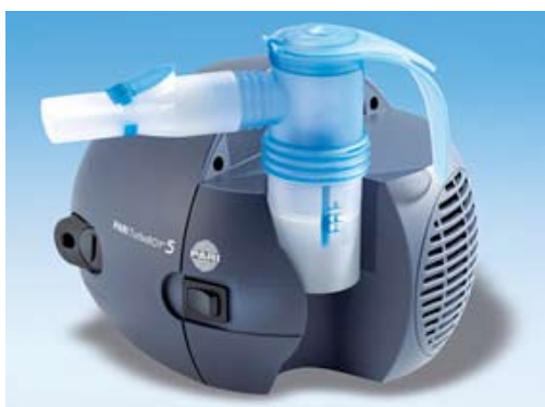
Figuur A.2.1 Elektrische vernevelaar