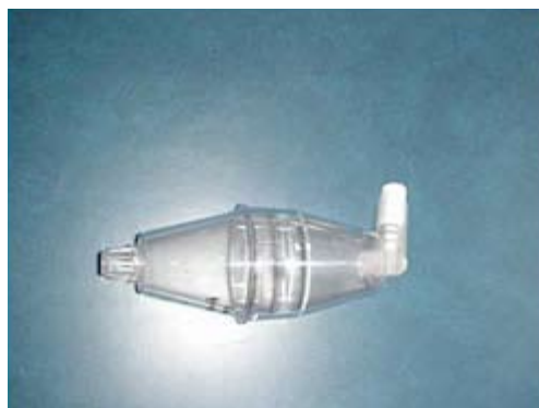
Figuur A.2.2 Inhalatie(voorzet)kamer