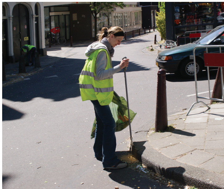
Social return wordt vaak toegepast in die sectoren waar eenvoudig werk voorhanden of te creëren is

Wwb'ers en sw'ers Gemeenten zetten bij social return bij voorkeur Wwb'ers in (ruim 80% van de gemeenten die aan de web-enquête deelnamen) en mensen met een sw-indicatie (meer dan de helft van de gemeenten). Dit is begrijpelijk, gemeenten zijn immers verantwoordelijk voor de re-integratie van deze personen. Arbeidstoeleiding van Wwb-gerechtigden zorgt bovendien voor een directe besparing op uitkeringsgelden. Gemeenten richten zich bij social return overigens ook op groepen waarvoor ze op andere beleidsterreinen (Wmo, onderwijs(achterstandsbeleid)) verantwoordelijkheden hebben. Denk aan vroegtijdig schoolverlaters, jongeren met onvoldoende kwalificaties en stagiairs van MBO, speciaal on-