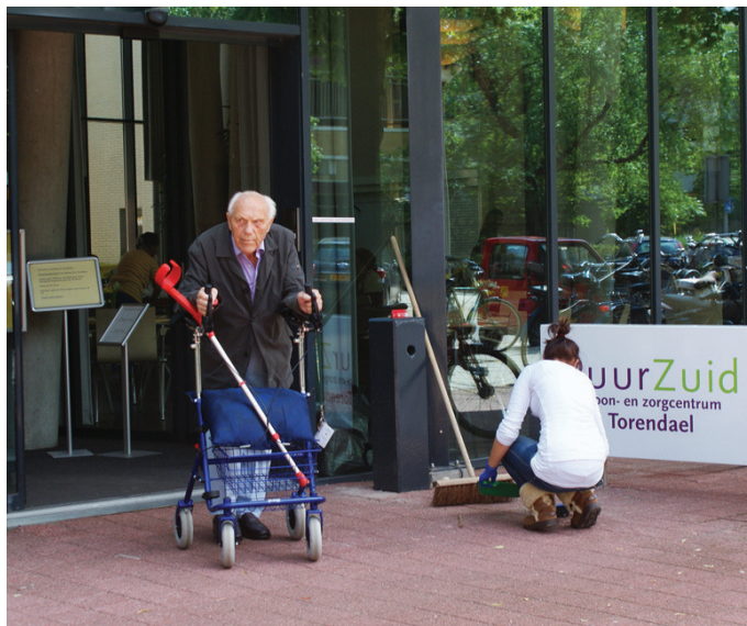
Stageplaatsen in de zorg, onderdeel van social returnspraken