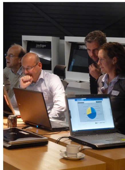
Begeleiding door Mooi Werk Trainer

Er is ook de mogelijkheid om in uw eigen organisatie trainers op te leiden tot Mooi Werk Trainer in een train-de-trainer traject van 3 dagdelen.