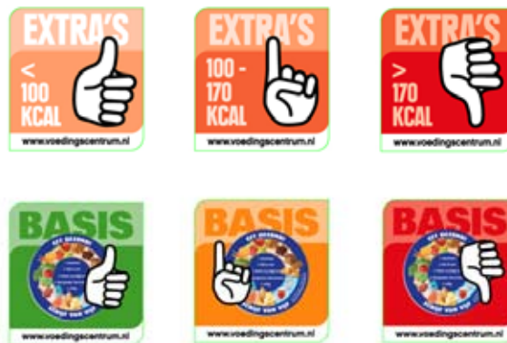
Figuur 1. Labels van het automatenexperiment

Om inzicht te krijgen in de consumptie van snoep, koek en snacks (hierna extra's genoemd) en (fris)drank, zijn de verkoopcijfers van de automaten geregistreerd. Ook zijn gegevens verzameld met behulp van registratieformulieren, lesobservaties, interviews en vragenlijsten.