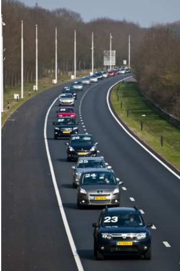
Figuur 2: Proef Coöperatieve Adaptive Cruise Control in Helmond.