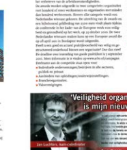
Onderhoud is een belangrijk onderdeel van de veiligheid op de werkvloer. Het Europees arb-agentschap OSHA zet zich dit jaar en volgend jaar extra in om de veiligheid in relatie tot onderhoud te vergroten.

Onderhoud is een belangrijk onderdeel van de veiligheid op de werkvloer. Het Europees arb-agentschap OSHA zet zich dit jaar en volgend jaar extra in om de veiligheid in relatie tot onderhoud te vergroten. Zo komt er onder meer een competitie voor veilige onderhoudspraktijken.