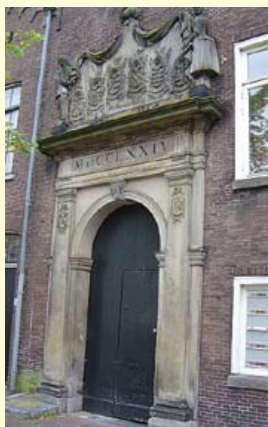
Voormalige bedrijfsingang met de zandstenen poort uit 1774.