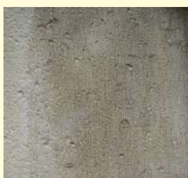
Voorgevel van het Stadhuis. Rechtsboven: de bordestrap. Rechts daaronder: Obernkirchener zandsteen met fossiele schelpen.

Het stadhuis is bij de brand van 12 februari 1929 (bij een buitentemperatuur van -18^{\circ}\text{C} !) grotendeels afgebrand. Stukken gevel en muur stonden nog gedeeltelijk overeind. Het stadhuis is daarna geheel gerestaureerd (1934-1940) door architect Blaauw, waarbij de oude gevel bewaard is gebleven. De bordestrap, de gevel en de muren bestaan vrijwel geheel uit geligbruine Bentheimer en Obernkirchener zandsteen. Ook na de grote brand van 1929 zijn deze zandsteensoorten gebruikt. Behalve de gelaagdheid zijn in het gesteente kriskrasstructuren en golfribbels te zien, ontstaan door stroming en golfwerking van de zee (o.a. links van de bordestrap). Enkele zandstenen blokken zijn fossielhoudend of laten Liesegangse ringen zien. Op werkdagen geeft de grote deur onder de bordestrap toegang tot de centrale hal van Burgerzaken. In het stadhuis zijn bij de restauratie veel soorten marmer gebruikt. De vloer is belegd met tegels van een fraaie zwarte en zeer fossielrijke Belgische hardsteen. Daarin zijn bryozoën (mosdiertjes), kolonievormende koralen, sponzen, schelpfragmenten van brachiopoden (armpotigen), gastropoden (slakken) en veel stengeldeeltjes