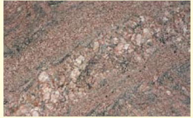
Migmatiet in de gevel van de Rabobank.