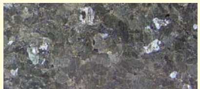
Rechts onder: larvikiet met labradorescentie-effect.