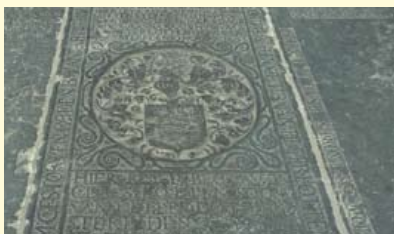
Grafstenen in de Hooglandse kerk van Namense kalksteen, zandsteen en 'petit granit'.