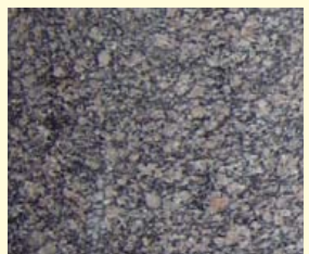
V.l.n.r.: Dienstingang van V&D, crinoïdenkalksteen met fossielgruis en stylolieten, biotietgraniet met alkaliveldspaat.