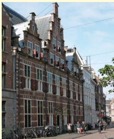
De Waalse kerk; Rijnlandhuis met toegangspoort.

bestaande uit baksteen in combinatie met lichtbruine Obernkirchener zandsteen (zie foto ingangspoort). Voor de stoeptegels is blauwgrijze Belgische hardsteen gebruikt.