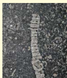
Links: monumentale gevel van de Stadsgehoorzaal. Rechts: Koraal en zeeleliestengel.