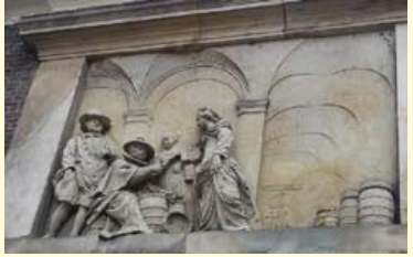
Waaggebouw aan de Aalmarkt. Rechtsboven: zandsteen met de zgn. Liesegangse ringen. Rechts daaronder: het zandstenen zijgevelreliëf 'uitreiking haring en wittebrood'.

toezicht van bouwmeester Pieter Post geconstrueerd ter vervanging van een houten gebouw. De begane grond is vrijwel helemaal opgetrokken uit geligbruine Bentheimer zandsteen op een plint van blauwgrijze Namense steen. De zandstenen laten voorbeelden zien van Liesegangse ringen, bruine banden en ringen van een ijzerverbinding: limoniet. De voorgevel toont fraai gebeeldhouwde reliëfs van zandsteen en een reliëf (weegbedrijf) in marmer. De zijgevel toont een reliëf 'het uitdelen van haring en witte brood'.