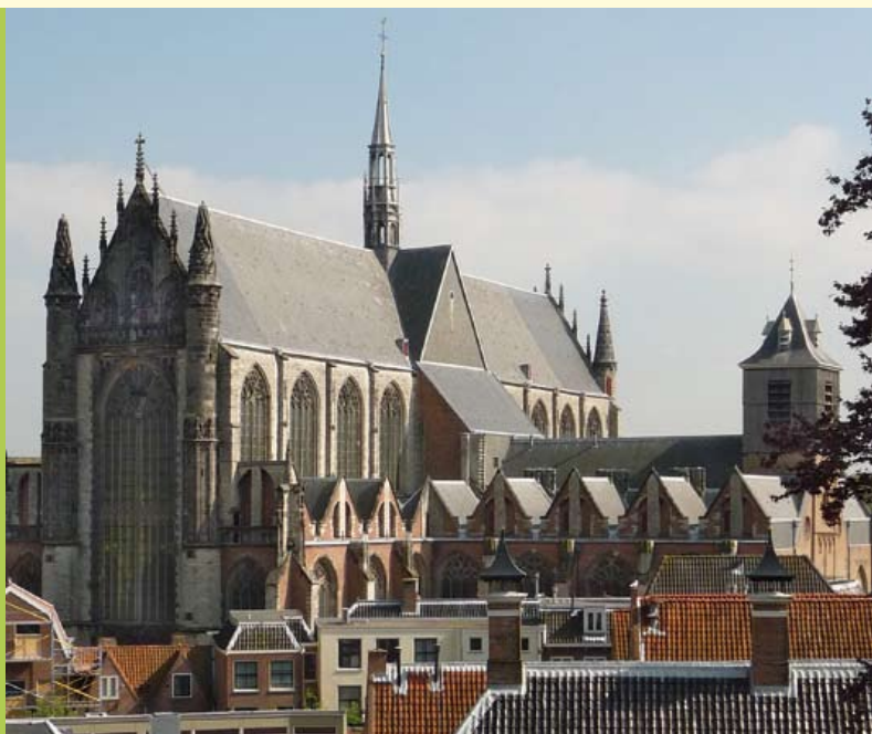
Gezicht op Hooglandse kerk met het houten noodtorentje. Aan de hoofdingang is Gobertanger, Ledesteen en Bentheimer verwerkt.

In de Romeinse tijd en in de 10de tot 13de eeuw was tufsteen de meest gebruikte bouwsteen in Nederland. Op het vervoer over de Rijn werd vanaf de 13de eeuw veel tol geheven, waardoor het transport van tufsteen duur werd. Mede daarom werd de Bentheimer zandsteen, die direct over de grens bij Oldenzaal werd ontgonnen, vanaf het begin van de 14de eeuw langzamerhand als bouwsteen in het westen van ons land geïntroduceerd.