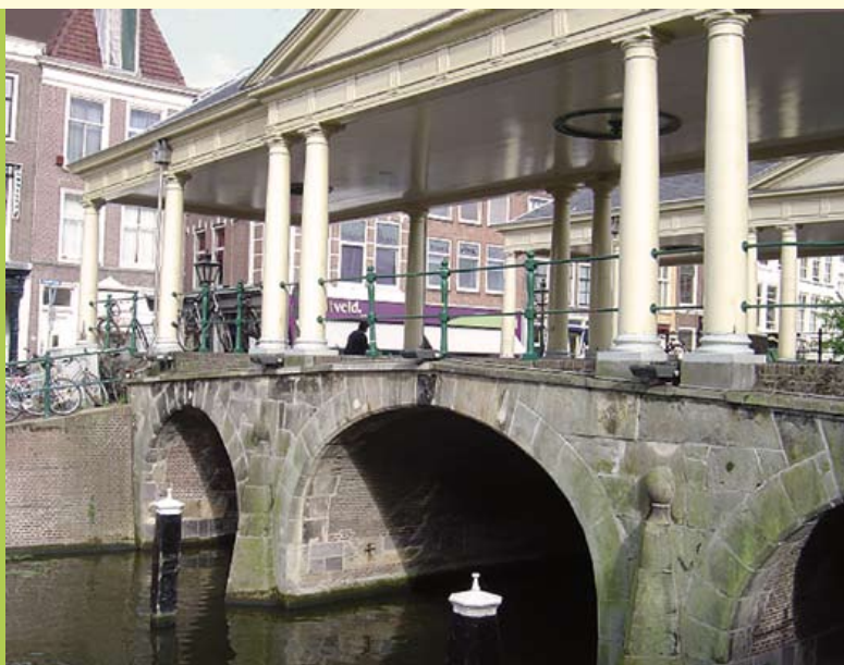
Koornbrug met een restauratie van een verweerd deel onderin de middenboog.

Direct rechtsaf de Vismarkt op en doorlopen naar de Koornbrug. Op deze brug uit 1642 werd - zoals de naam aangeeft - koren verhandeld. In de 19e eeuw werd de brug overkapt. Bij de restauratie van een verweerd deel werd vaak goedkope, lokaal geproduceerde baksteen gebruikt. Op de waterlijn werd de meer duurzame zandsteen toegepast.