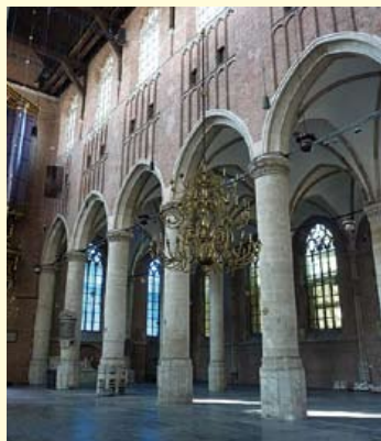
Voorgevel Pieterskerk met hoofdingang. In het interieur zijn zandstenen pilaren en bogen te zien.