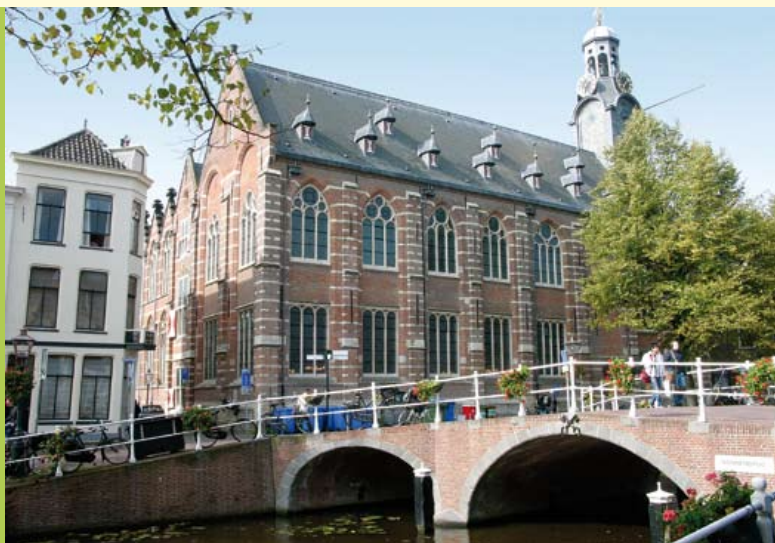
Nonnenbrug met het Academiegebouw. Rechts: gevel in baksteen en de plint van Gobertanger en Bentheimer zandsteen.

Van het Gerecht recht door, via de Houtstraat naar het Rapenburg. Hier linksaf het Rapenburg op (niet de brug over). Na ongeveer 100 meter rechtsaf over de Nonnenbrug, die een goed uitzicht geeft op het voormalige klooster van de Witte Nonnen (Dominicanessen) uit 1507, waar sinds 1581 de universiteit van Leiden zetelt. De stichting van de universiteit was een geschenk van Willem van Oranje in 1575 aan de stad Leiden als dank voor het geboden verzet tegen de Spanjaarden tijdens het beleg van Leiden. Dit gebouw is ook grotendeels opgetrokken uit baksteen, met een basis van Bentheimer zandsteen en 'witte Belgische steen' (Gobertanger en Ledesteen). Ga nu rechtsaf het Rapenburg op langs voorname Leidse woonhuizen met gevels die voornamelijk uit baksteen of zandsteen zijn opgebouwd. Natuursteen wordt tegenwoordig vaak geschilderd, in feite een oude traditie ter bescherming van de natuursteen, maar ook met een decoratief effect. Langs het trottoir komen op verschillende plaatsen hardstenen zuiltjes voor.