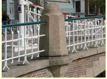
Blauwpoortsbrug met een zuil van graniet.

Deze brug heeft fraaie zuilen van grofkorrelige graniet. We wandelen vervolgens over de brug, rechtsaf over de Prinsessekade, die na de volgende brug over het Galgewater Kort Rapenburg heet.