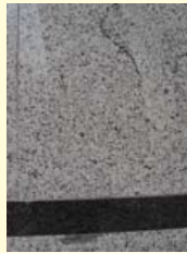
Warenhuis HEMA. De kolommen onderin de gevel zijn van biotietgraniet en gabbro.