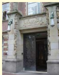
Achterzijde stadhuis. Rechtstboven: Zwart en wit marmer en lichtbruine kalksteen in de hal van het Stadhuis. Rechts daaronder: Hoofdingang van zandsteen met een basis van graniet.

van crinoïden (zeelelies) te zien. Ook in de natuurstenen platen van de balie bevinden zich mooie fossielen.