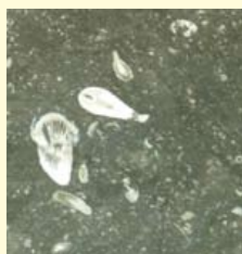
V.l.n.r.: Centrale hal Burgerzaken, Belgische hardsteen met brachiopodenschalen, crinoïden en koraalfragmenten.