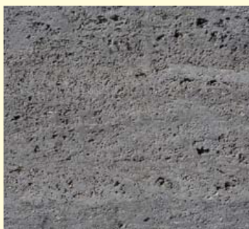
Duitse poreuze Muschelkalksteen.