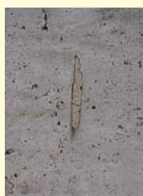
Stopsel in travertijn.

uit Italië. De platen verkeren in vrij slechte staat. De vele poriën van het gesteente zijn goed te zien en de grotere holten zijn gestopt met een vulmiddel. Tussen de travertijnplaten komen stroken van blauwgrijze, grofkristallijne gneis voor.