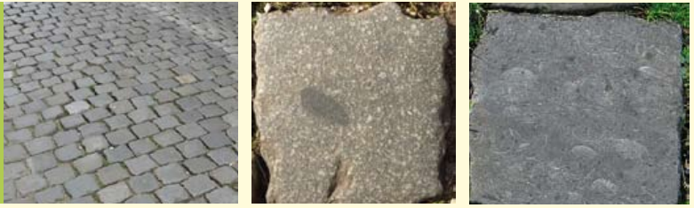
V.l.n.r.: Kinderhoofdjes (kasseien) in de Burgsteeg, porfier van Quenast, kalksteen met schelpenresten.

De Koornbrug oversteken en de Burgsteeg inlopen. In de stegen rond de Hooglandse Kerk liggen interessante straatstenen, de zgn. kinderhoofdjes. De stenen verschillen in aard en samenstelling, structuur en mineraal- of fossielinhoud.