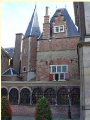
Voorzijde (links) en achterzijde (rechts) van het Gravensteen.