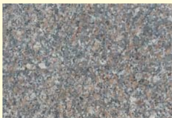
Granieten vloertegels sieren de ingang van de ABN AMRO bank.