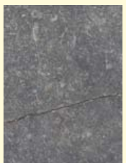
Onderin de gevel van Villa de Kroon grof geschuurde en grof gehakte kolenkalksteen. Bovenin een gele zandsteen.