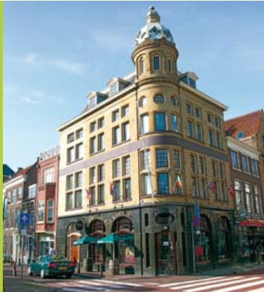
Links boven: Gijsselaarsbank van baksteen.

Pub), op de hoek van het Noordeinde met het Rapenburg. In de gevel van 'Café North End' is een fraai voorbeeld te zien van twee soorten natuursteen. Het benedendeel van het hoekhuis is bekleed met een donkere, blauwachtig-grijs reflecterende larvikiet (foto onder) met duidelijke labradorescentie. Voor het bovenste deel van dit pand is een geelbruine zandsteen (Obernkirchener) gebruikt.