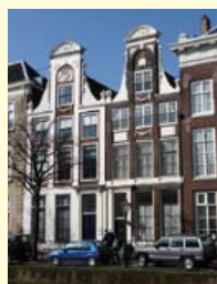
Met de klok mee: Het Sieboldhuis aan het Rapenburg nummer 19. De twee herenhuisen links ernaast met geschilderde natuursteen en een hardstenen zuiltje.