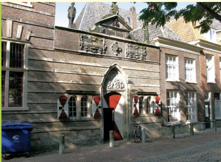
Ingang van het voormalige Heilige Geest weeshuis met zandstenen reliëfs.