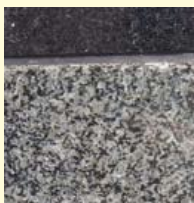
v.l.n.r.: Gevel van restaurant Luxor; detail met donkere doleriet en vrij grove gabbro.