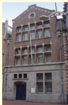
Woonhuis Breestraat 61.

Links hiervan in de Breestraat 61 is een oud woonhuis, nu in gebruik als tandartspraktijk. De benedengevel heeft een basis van biotietgraniet met daarop lichtbruine zandsteen.