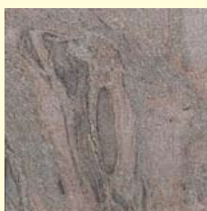
Migmatiet onderin de gevel.