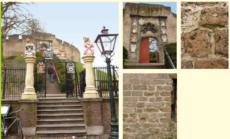
De Burchtring en beneden-entree met "Leidse" pilaren.

Bij verschillende restauraties zijn naast Römer tuf – die uitgeput raakte - ook andere tufstenen (Weiberner, Ettringer) uit dezelfde streek gebruikt. Ook zijn er diverse baksteensoorten, waaronder kloostermoppen (groot formaat bakstenen) zichtbaar.