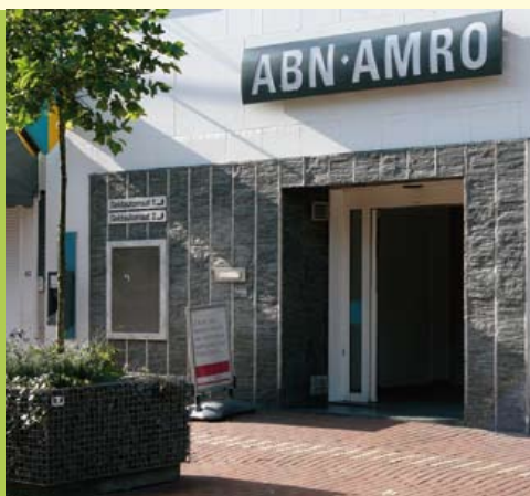
Gevel van ABN AMRO. Gneisplaten met dunne strookjes wit marmer.

Ongeveer 70 m verder op 81 staat een kantoor van de ABN AMRO bank. De ingang heeft een moderne gevel met tegels van biotietgneis. Deze gneis is vrij donker en was oorspronkelijk waarschijnlijk een sedimentair gesteente (paragneis). Tussen de gneisplaten zijn dunne strookjes wit marmer aangebracht.