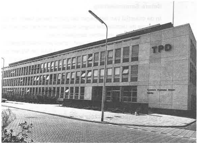
De Technisch Physische Dienst TNO-TH: vrucht van succesvolle samenwerking.

aan de technische hogeschool. Zo is het laboratorium voor fysische technologie, dat in 1949 in gebruik is genomen een vorstelijk geschenk geweest van de Bataafse Petroleum Maatschappij. Ook andere chemische industrieën hebben door financiële en materiële steun het wetenschappelijk en technologisch onderzoek aan de technische hogeschool bevorderd. Met behulp van de Nederlandse suikerindustrie kon de afdeling der Scheikundige Technologie reeds zeer lange tijd geleden beschikken over een volledige suikerfabriek op semi-technische schaal. Ook het microbiologisch-en het biochemisch onderzoek aan de technische hogeschool hebben al decennia lang belangrijke steun ondervonden van de voornaamste industrieën in ons land. De elektrotechnische industrie heeft zich evenmin onbetuigd gelaten met het geven van ruime financiële en materiële steun aan de technische hogeschool.