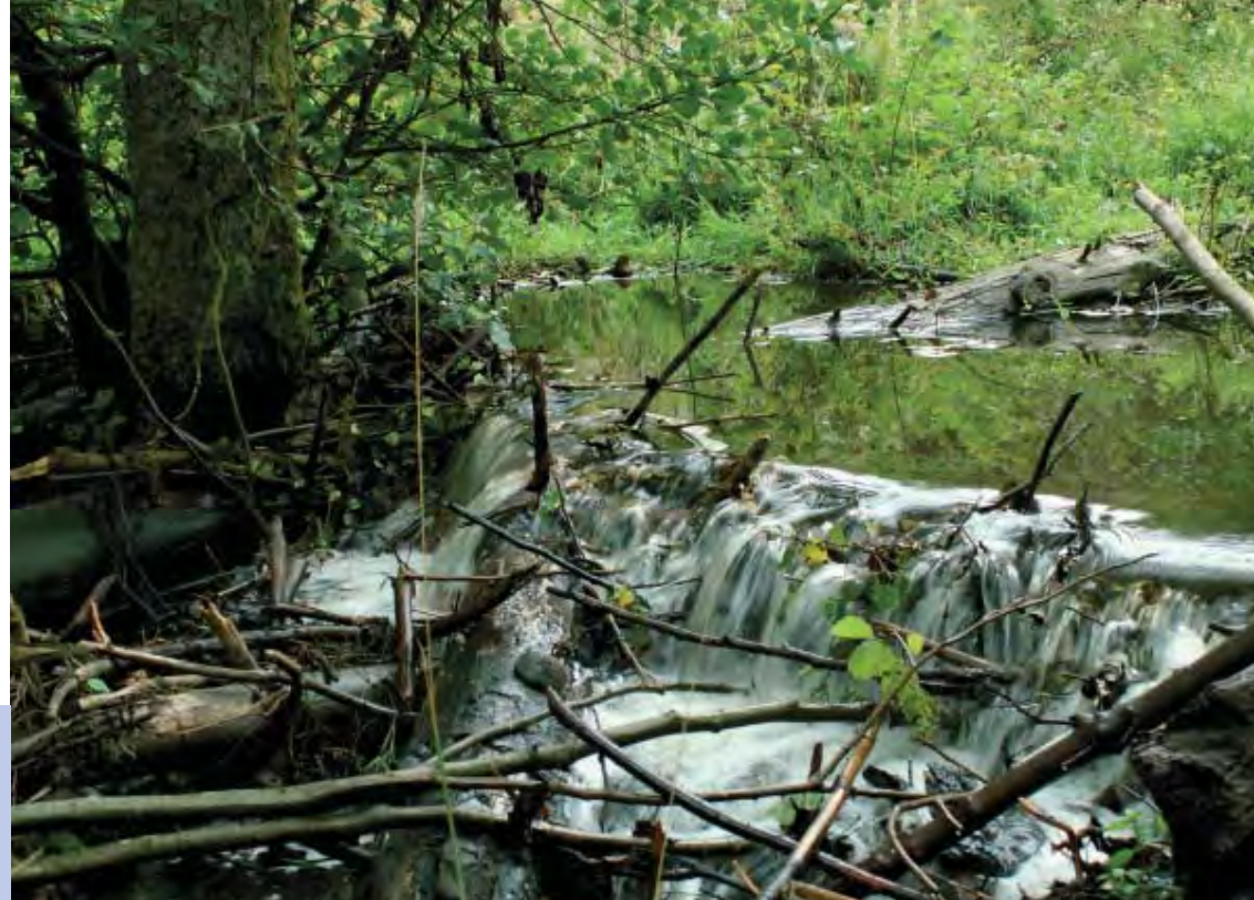
Beverdam met daarvoor een ontstaan 'bevermeertje'.