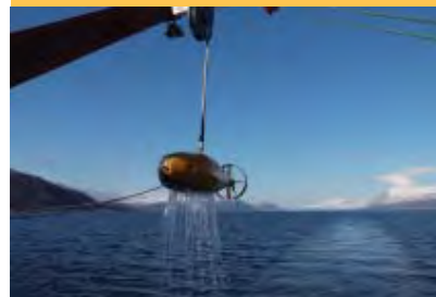
De Socrates sonarbron als hij uit het water wordt gehaald achter het schip en weer aan dek wordt gezet na gebruik. Tijdens gebruik van de sonar wordt de gele vis door het water gesterkt op ca 60m diepte.