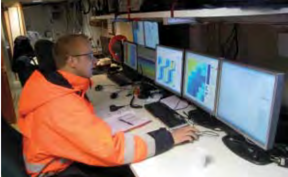
Het opsporen van walvissen gebeurt zowel visueel als akoestisch met het Delphinus systeem

grotere afstand kan worden aangebracht. Als de zender op het dier zit, begint het experiment. Voordat de geluidsbron wordt gestart bestuderen biologen het 'natuurlijke' gedrag van het gezenderde dier. Volgens een vooraf afgesproken protocol (met een streng veiligheidsvoorschrift) wordt vervolgens geleidelijk sonargeluid uitgezonden, en daarna richting de walvis gevaren. Zo proberen onderzoekers een duidelijke grenswaarde te vinden voor de intensiteit van het geluid waarbij een reactie van de walvis wordt waargenomen.