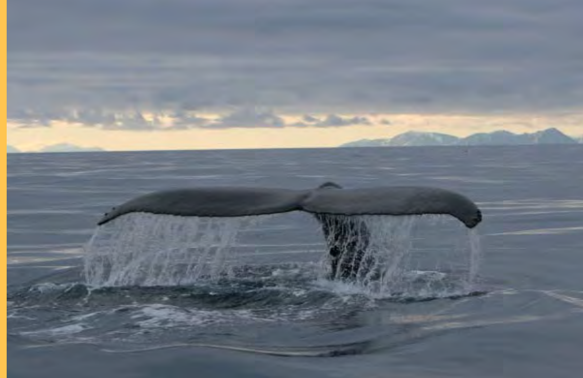
Duikende bultrug nabij Spitsbergen.