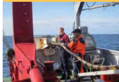
Het uitrollen van de slang met hydrofoons (onderdeel van het Delphinus-systeem).

Er zijn dus twee manieren voor de onderzoeker om te kunnen luisteren onder water: vanaf het schip met het gesterkte Delphinus hydrofoon-array, en meeluisteren met de walvis met de Dtag-zender.