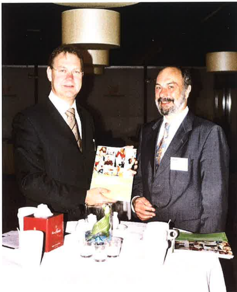
Overhandiging van boek aan Minister de Geus.